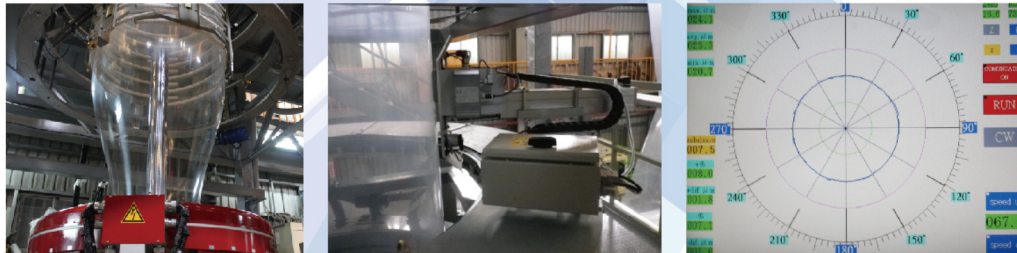
Смарт авто-обдувочное кольцо